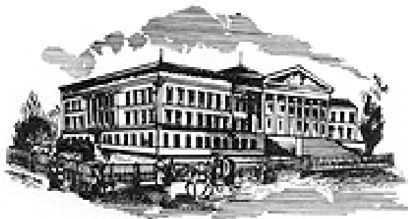
MAGYAR NEMZETI MÚZEUM

Megelevenedtek előttünk nemzetünk jellemzői, értékei. Még jobban megerősödött bennünk a büszkeség, hogy mi is ehhez a nemzethez