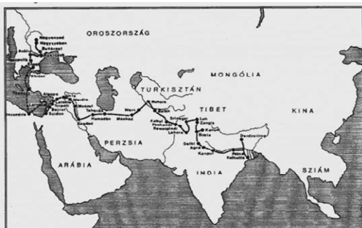
Kőrösi Csoma Sándor kutatóútja

4. Hány kilométert járt be a tudós kutatóútja során?